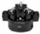
zaliti kabelski priključek