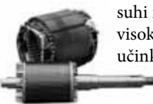
suhi motor visoke učinkovitosti